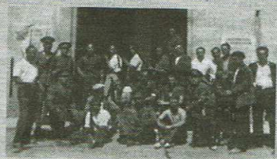
Membres del Comitè Antifeixista de Blanes.