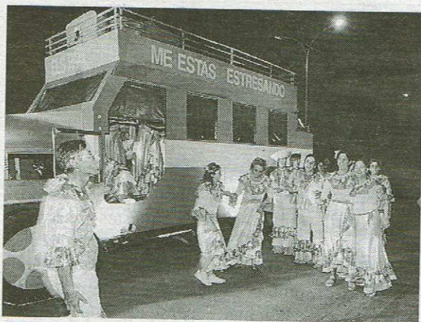
Una de les comparses del carnestoltes.